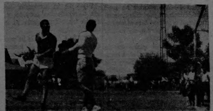
Leca Campos y su defensa ven horrorizados pasar la bola en el juego de veteranos.