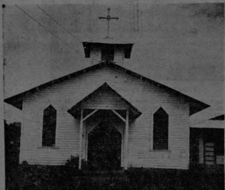
Este es el templo católico que con la cooperación de los vecinos y de la Chiriquí Land Company ha sido levantado en Finca Laurel. Cada tres domingos se llevan a cabo en él oficios religiosos que son muy concurridos siempre.