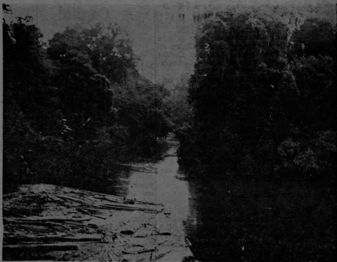
De los grandes ríos del Sur del país, el de Coto es uno de los más bellos. Discurre por el valle poblado en parte de grandes selvas, parte de las cuales han ido dejando campo a los hermosos bananales que el esfuerzo del hombre ha levantado para hacer a esas tierras centros de trabajo y de prosperidad. Como un retazo de romántica grandeza, esta estampa del Coto en uno de sus recorridos, cuando la tarde apenas ilumina sus aguas calmas y las copas de los árboles gigantes de la selva.